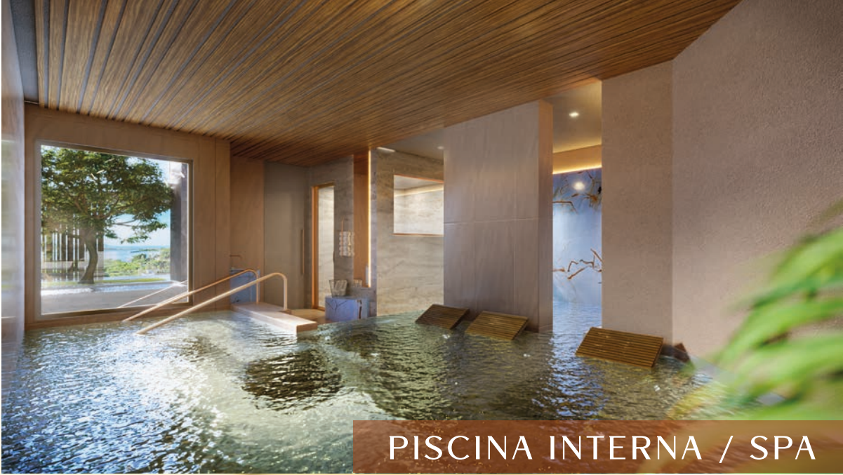
PISCINA INTERNA / SPA