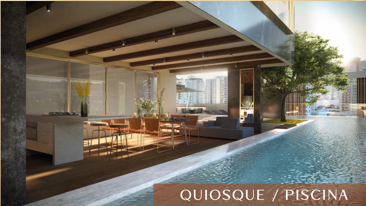
QUIOSQUE / PISCINA